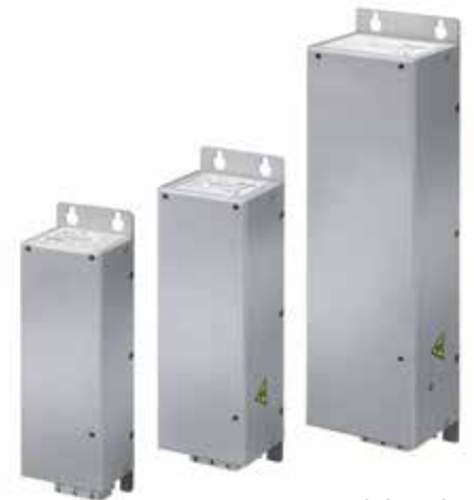
Tamaños de bastidor Tres tamaño del bastidor de los filtros de línea distintos se corresponden con los alojamientos M1, M2 y M3 del convertidor de frecuencia VLT® Micro